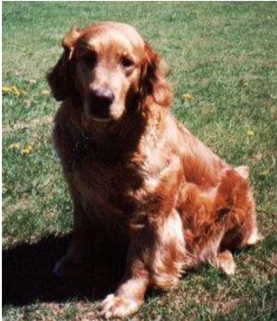
CIBELLE NUKY (NUKY)